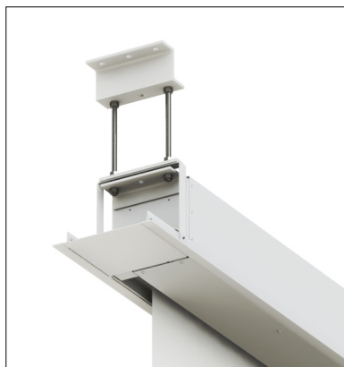
Vestavbový rám a projekční plochu lze montovat nezávisle