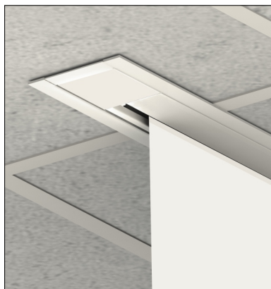
Komfortní a opticky čistá vestavba do podvěšených stropů